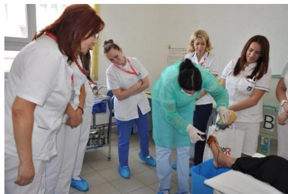
Njega pacijenta sa hroničnom ranom

Medicinske sestre/tehničari u svakodnevnom pružanju usluga iz oblasti zdravstvene njege rukovode se Procesom zdravstvene njege koji se sastoji iz nekoliko etapa: procjena potreba za zdravstvenom njegom, planiranje aktivnosti, cilj koji želimo da postignemo, realizacija i evaluacija. Proces zdravstvene njege je prilagođen individualnim potrebama pacijenta.