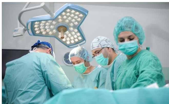
Sestra u operacionoj sali

Prateći svoj djelokrug rada, medicinske sestre/tehničari su ravnopravni članovi rehabilitacionog tima.